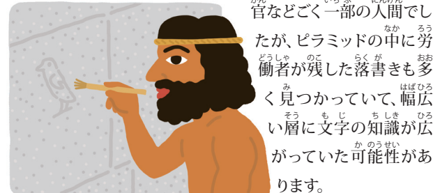
ルクソールのカルナック神殿に刻まれたヒエログリフ。

初めのころのヒエログリフは、王や貴族の功績や神の言葉を記すために、石碑などに刻まれていました。下書きに合わせていねいに彫られ、あざやかな色をつけたものも多くありました。カヤツリグサの一種からパピルスとよばれる紙を作る技術が発達すると、墨と筆でも書くようになり、役所の記録など多くの文書に書かれるようになりました。文字を扱うのは役人や神官などごく一部の人間でした。